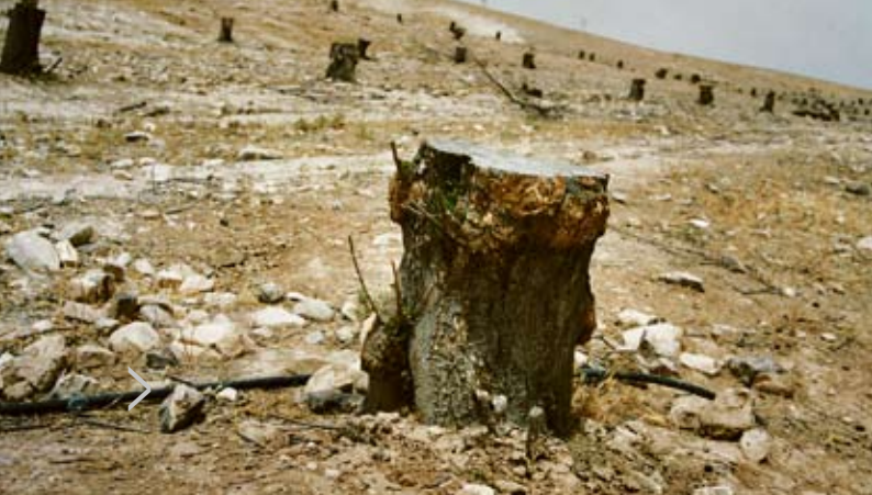
De vernietiging van Palestijnse olijfgaarden, "om redenen van veiligheid"