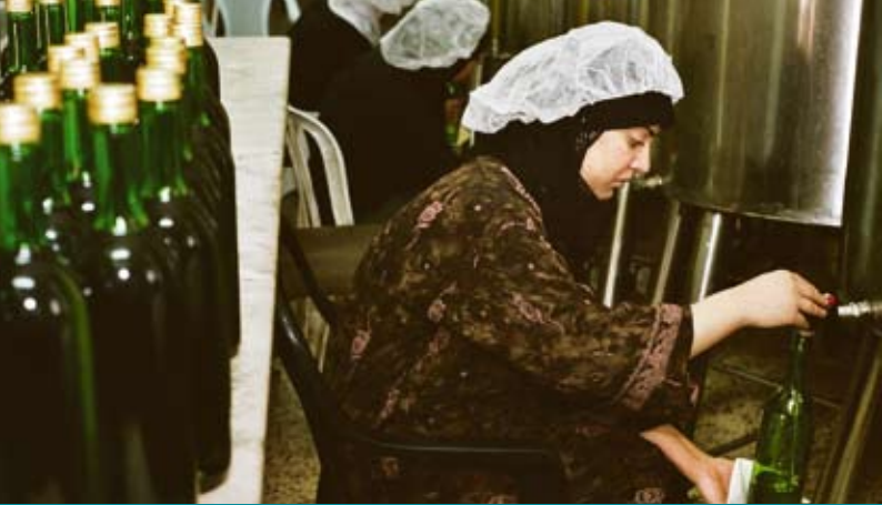
Het afvullen van olijfolie bij onze partner PARC