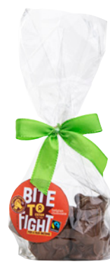
24645 Chocoladefiguurtjes melk 5x15g, €2,80*