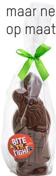
24635 Sint melkchocolade 150g, €5,00*

We tonen met plezier ons assortiment eerlijke chocolade maar neem gerust contact op, dan werken wij een voorstel op maat uit.