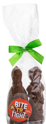
24643 Sint+piet melkchocolade 2x35g €2,75*