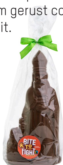
24640 Grote Sint melkchocolade 250g, €6,75*