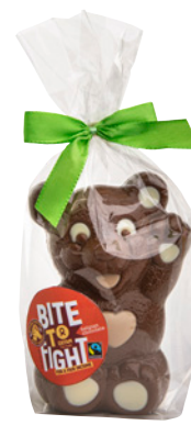
24646 Beertje melkchocolade 90g, €3,40*