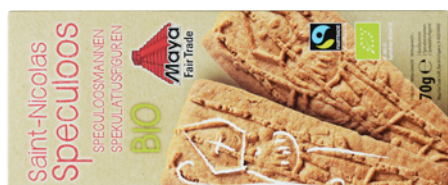
26491 BIO Speculoos Sint (MAYA) 2x35g, €1,20