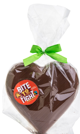
24644 Chocoladehart melk 75g, €2,60*